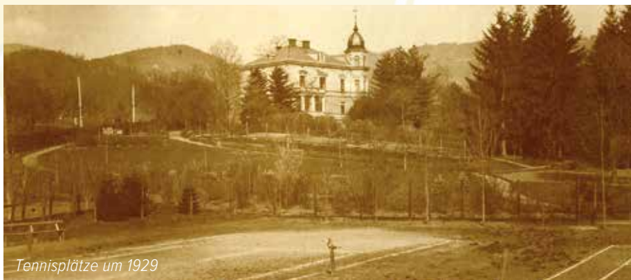
Tennisplätze um 1929

Alle Infos unter www.tennis-deutschlandsberg.com