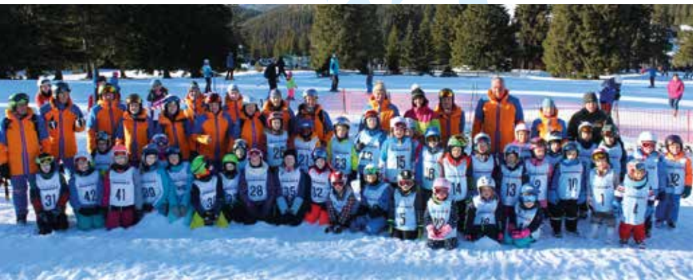
Die stolzen Pistenflitzer der Naturfreunde DlbG. bei der Siegerehrung