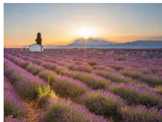
Von der Cote d'Azur bis zu unendlich verlaufenden Lavendelfeldern

Mo, 6. März 2023, 19:30 Uhr, Laßnitzhaus