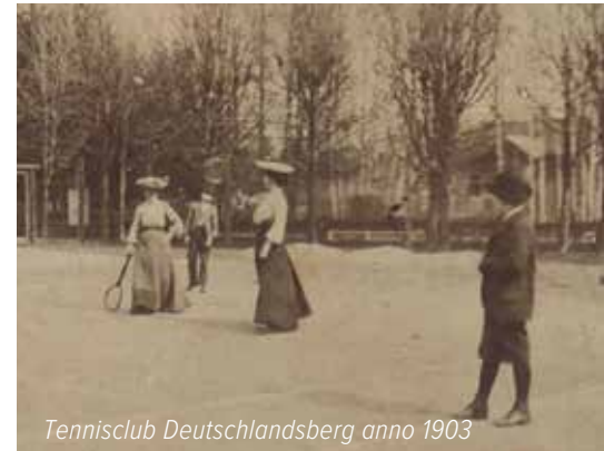
Tennisclub Deutschlandsberg anno 1903