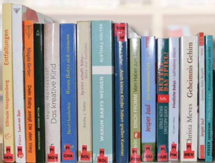
In der Stadtbücherei und im EKIZ steht eine Reihe hochwertiger Literatur zum bewussten Umgang mit Kleinkindern zur Verfügung. Nützen Sie diese Möglichkeit!

WEITERE INFORMATIONEN UND ANMELDUNG: www.rainbows.at