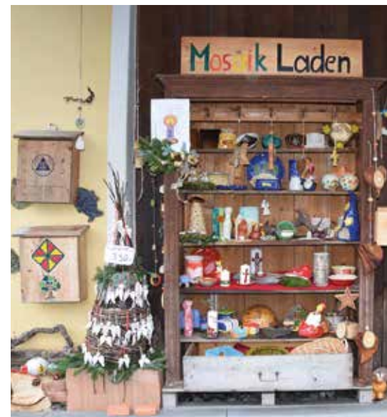
Der Mosaik-Laden mit den liebevoll hergestellten Geschenkideen erfreut sich großer Beliebtheit und ist rund um die Uhr geöffnet.