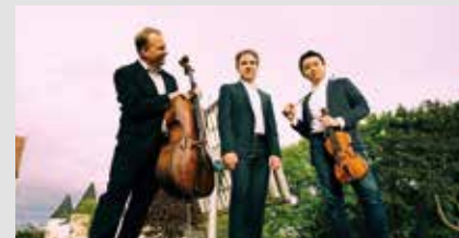
Altenberg Trio Wien