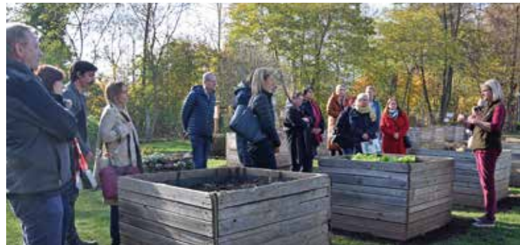
Führung durch den Stadtgarten