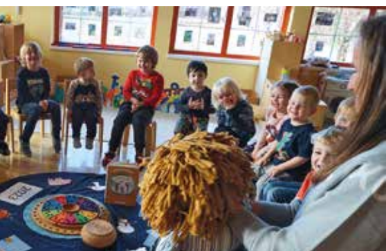
Kinder bei einem Kreisenspiel im WIKI Kindergarten Bad Gams

0664 / 851 03 20, kiga.badgams@wiki.at www.wiki.at