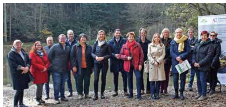
Feierliche Eröffnung der Infrastruktur am Nymphenweiher mit Projektpartnern und politischen Vertreter:innen