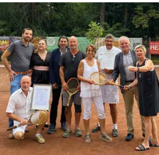
Siegerehrung mit Ehrengästen