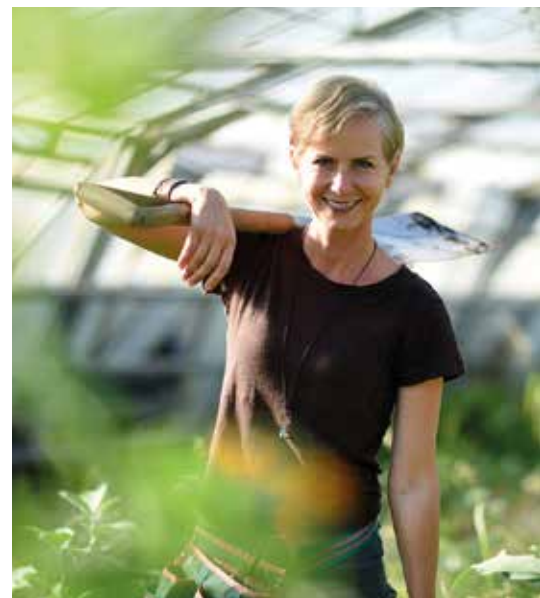
Angelika Ertl, TV-Moderatorin, Gärtnerin und Autorin

Gärten haben an großer Bedeutung gewonnen. Nicht nur für biologisches Gemüse und den Selbstanbau, sondern auch in Bezug auf den Klimawandel. Jeder Hausgarten kann mit einfachen Maßnahmen einen wesentlichen Beitrag leisten. Umso wichtiger ist es, wieder dem »naturnahen Gärtnern« Licht zu gewähren: Ökologische Zusammenhänge und natürliches Gärtnerwissen stehen im Vordergrund. Bei der Schädlingsbekämpfung gibt es natürliche und sanfte Methoden und alte Hausmittel sind die beste Apotheke des Gartens.