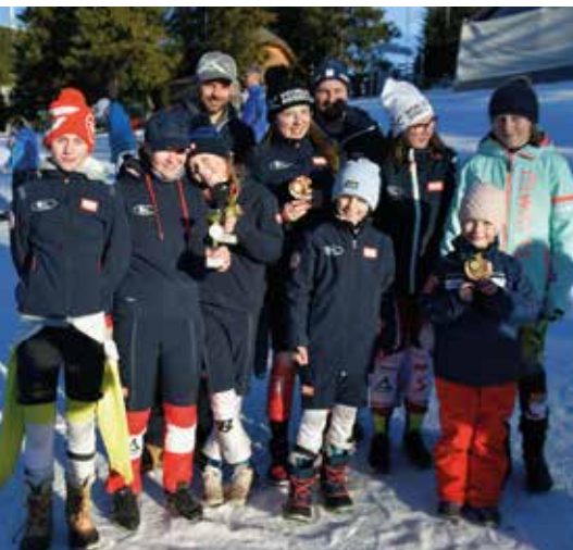
Die erfolgreichen Athlet:innen des Schiklubs Deutschlandsberg

Traditionsgemäß fand das Riesentorlaufrennen am Dreikönigstag auf der Weinebene statt, wo die Athlet:innen beste Konditionen vorfanden. Vom Schigebiet, unter der Obsorge von Johann Sturm, wurde die Rennstrecke 1 exklusiv zur Verfügung gestellt, die Infrastruktur stammte vom Schiklub selbst.