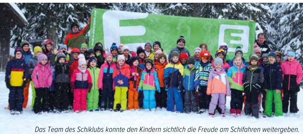
Das Team des Schiklubs konnte den Kindern sichtlich die Freude am Schifahren weitergeben.