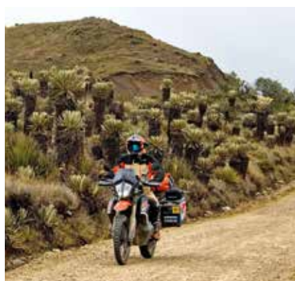
Abenteuer pur auf über 12.000 km

Sa, 4. März 2023, 19:30 Uhr, Laßnitzhaus